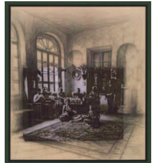
3. A „pipázó” (Rajzos kiegészítéssel)