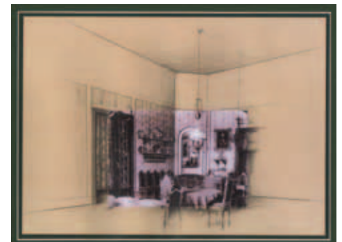
2. A nagy szalon (Rajzos kiegészítéssel)