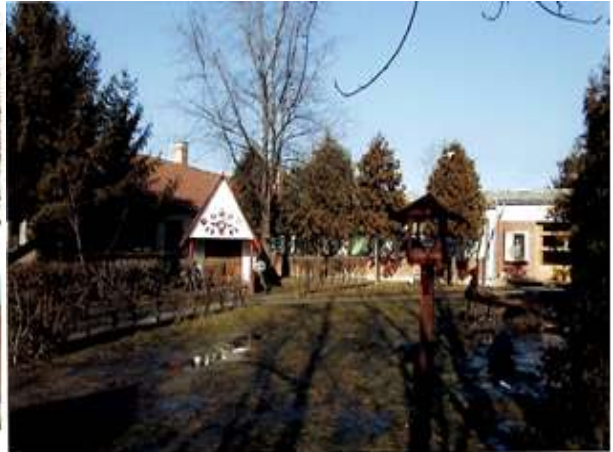
Az újabb óvoda még palatetővel, és vas ajtókkal elötető nélkül