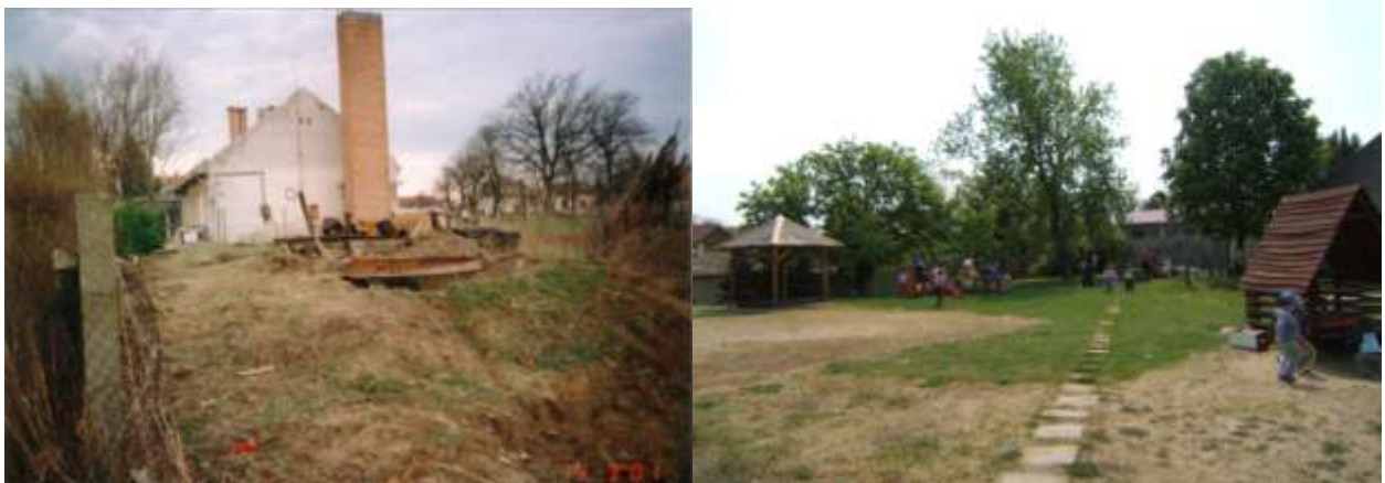
A mező utca felőli udvar