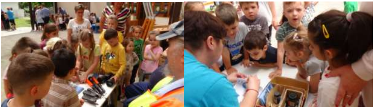
Hasznos tapasztalatok és a legilletékesebbektől kapott tudás