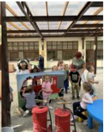
19. éves kapcsolat